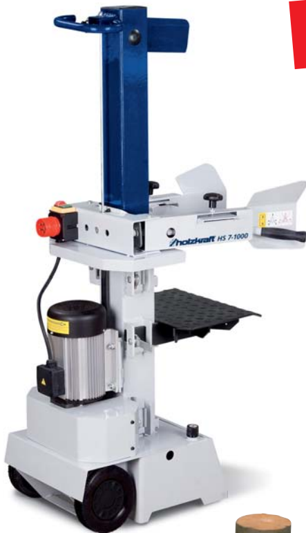
HS 7-1000 (400 V) Rönkhasító